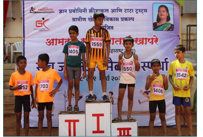
ज्ञान प्रबोधिनी निगडी - क्रीडाकुल क्रीडास्पर्धा