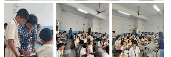
ज्ञानसेतू प्रकल्प - विज्ञान व गणित प्रदर्शन प्रात्यक्षिक