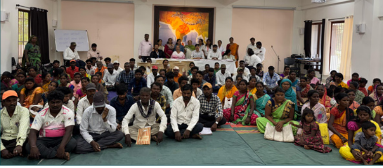
स्त्री-शक्ति प्रबोधन, ग्रामीण - कातकरी विकास प्रकल्प