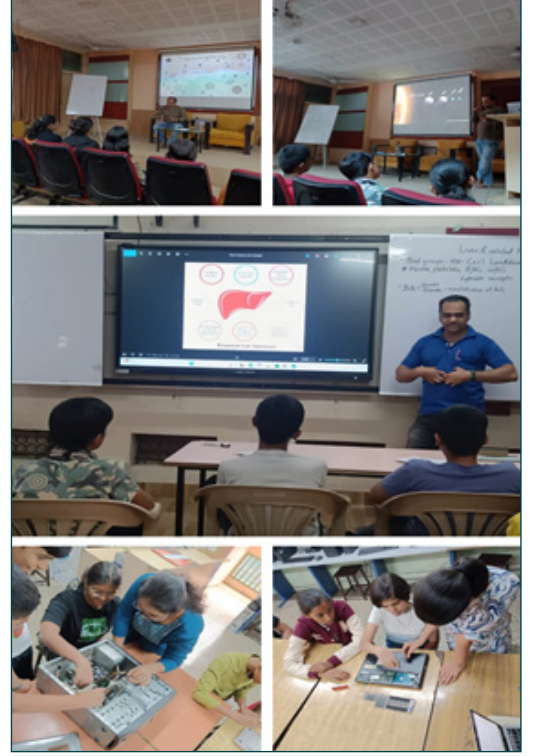
छोटे सायंटिस्ट्स प्रकल्प Out of the Box कार्यशाळा