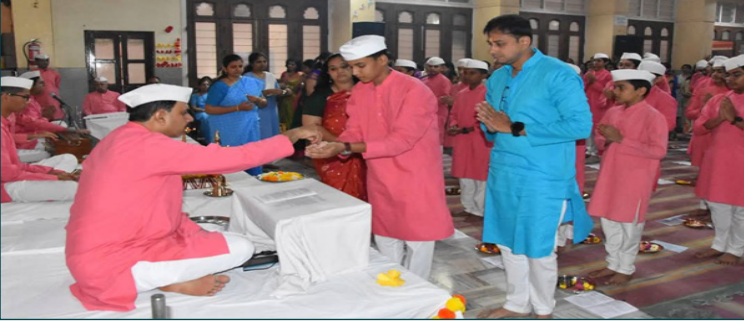
ज्ञान प्रबोधिनी प्रशाला, पुणे - विद्याव्रत संस्कार