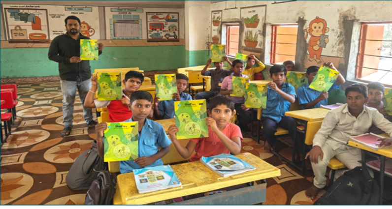
शैक्षणिक साधन केंद्र - निसर्गमित्र ऑलिंपियाड