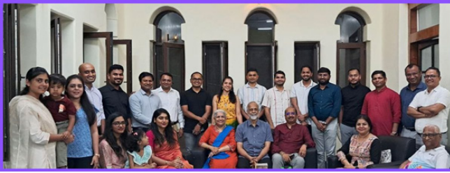
ओरिसा-छत्तीसगड अधिकारी भेटी दौरा