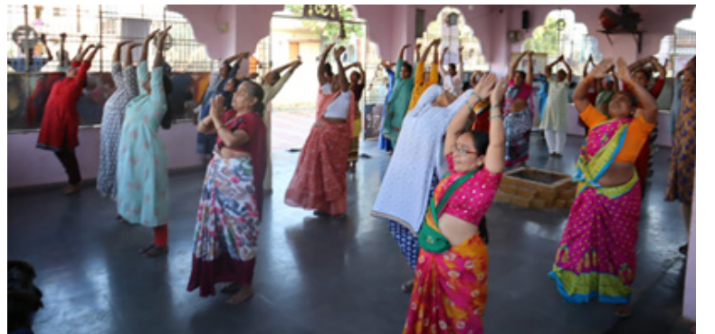
ज्ञान प्रबोधिनी सोलापूर - प्राणायाम वर्ग