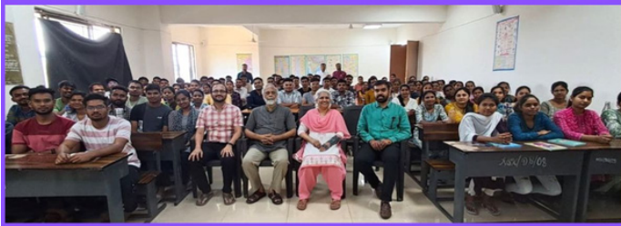
Co Apt टेस्ट - नेतृत्व साधना केंद्र - रायपूर