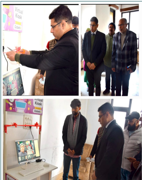
आभासी प्रयोगशाळा उद्घाटन-मनकोट