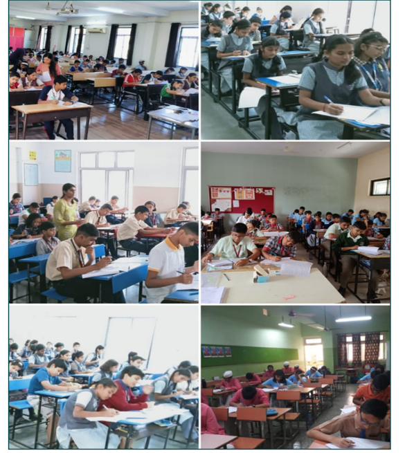
शैक्षणिक उपक्रम संशोधिका - गणित प्रभुत्व परीक्षा आयोजन