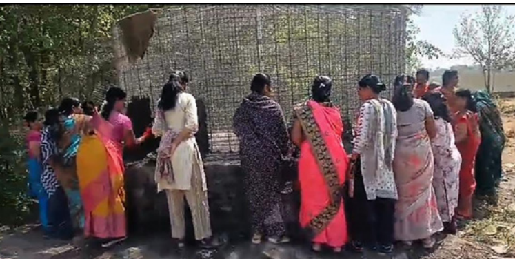
ज्ञान प्रबोधिनी हराळी : प्रदेशविकसन