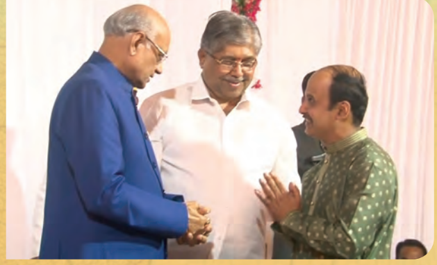
मुंबई येथील स्नेहमेळाव्यात मा. राज्यपाल रमेशजी बैस व चंद्रकांतदादा पाटील यांची भेट