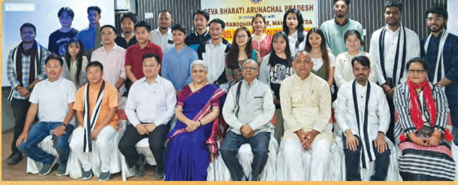
अरुणाचल प्रदेश – केंद्रीय लोकसेवा आयोग प्रशिक्षण वर्ग २०२३-२४ समारोप प्रसंगी उपस्थित मान्यवर व विद्यार्थी