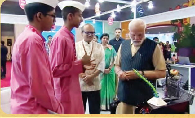
दिल्ली येथील प्रदर्शनात प्रशालेच्या एलिफायर प्रकल्पाच्या स्टॉलला मा.पंतप्रधानांची भेट