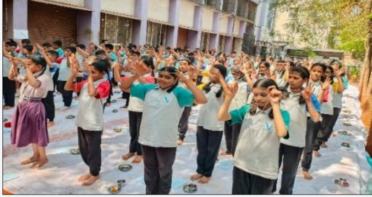
१२३ विद्यार्थ्यांचा विद्यारत्र संस्कार कार्यक्रम.

यावर्षी ७ वी च्या दोन वर्गातील १२३ विद्यार्थ्यांसाठी एकूण ३ मेळावे व ५ दिवसांचे शिबिर झाले. युक्ताहार विहार, इंद्रिय संयमन, दैनंदिन उपासना, स्वाध्याय प्रवचन, सदुरू सेवा, राष्ट्रार्चना ही ६ व्रते विद्यार्थ्यांना समजावून सांगण्यात आली.