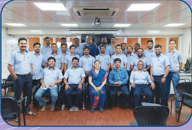
प्रज्ञा मानस संशोधकेतर्फे कांदिवली येथे महिंद्रा कंपनीमध्ये प्रशिक्षण