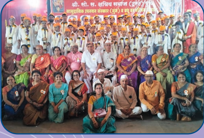
सामूहिक उपनयन संस्कारात सहभागी बटू व संत्रिका गट