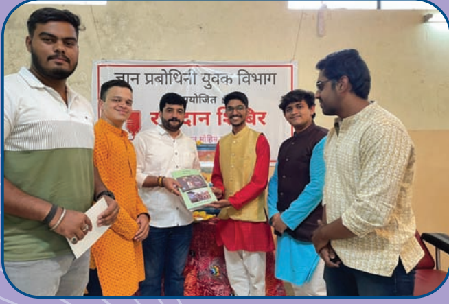
युवक विभागातर्फे कोथरूड येथे रक्तदान शिबिर