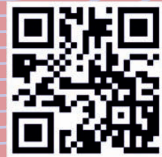
ज्ञान प्रबोधिनी फेसबुक पेज