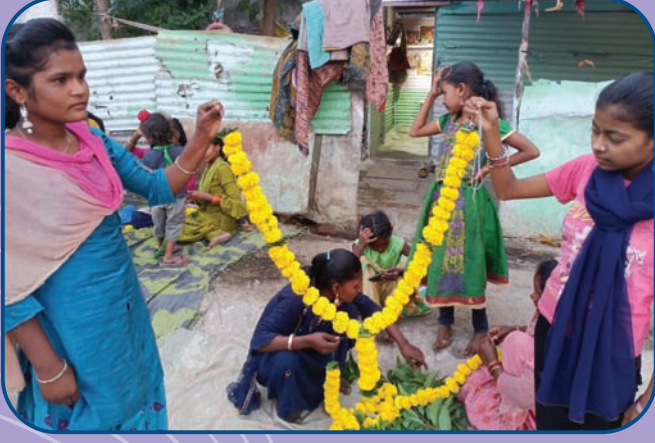
अंबाजोगाई केंद्रातर्फे वस्त्यांवरील मुलामुलींना हार बनवण्याचे प्रशिक्षण