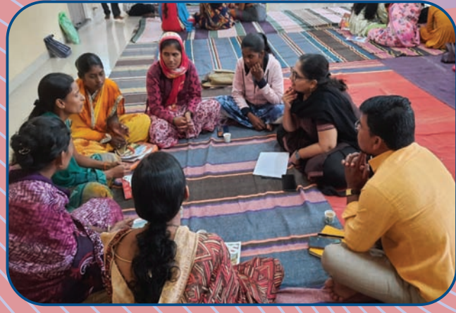
आनंदी शिक्षण प्रकल्प प्रशिक्षण वर्ग