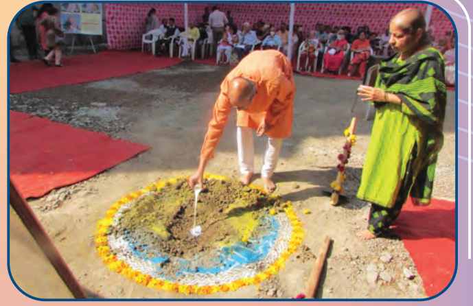
शुक्रवार पेठेतील सामाजिक शास्त्रे संशोधन संकुलाचे भूमिपूजन