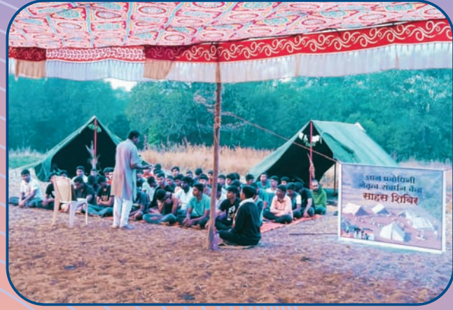
नेतृत्व संवर्धन केंद्रातील विद्यार्थ्यांचे केळद (ता. वेल्ले) येथील साहस शिबिर