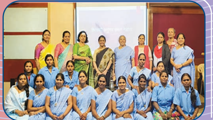
स्त्री शक्ती ग्रामीण विभागाचा हिरकणी विस्तार मेळावा