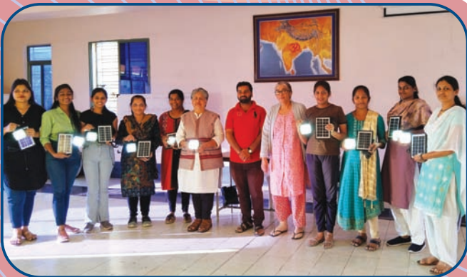
नागरीवस्ती अभ्यासगटातील युवतींचे सौर दिवे जुळणी प्रशिक्षण