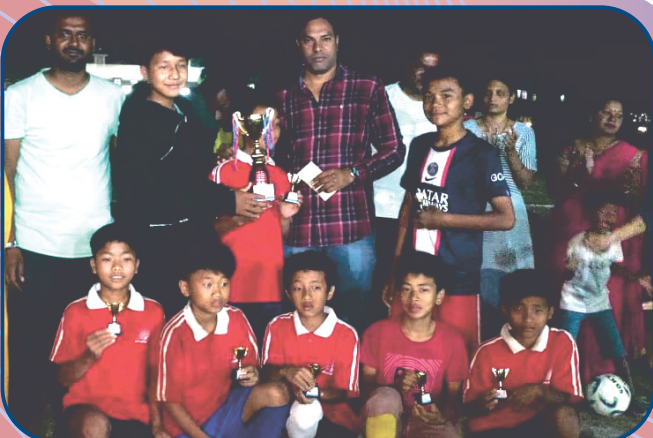
फूटबॉल स्पर्धेत यश मिळविणारे सोलापूर सहनिवासातील मणिपुरी विद्यार्थी