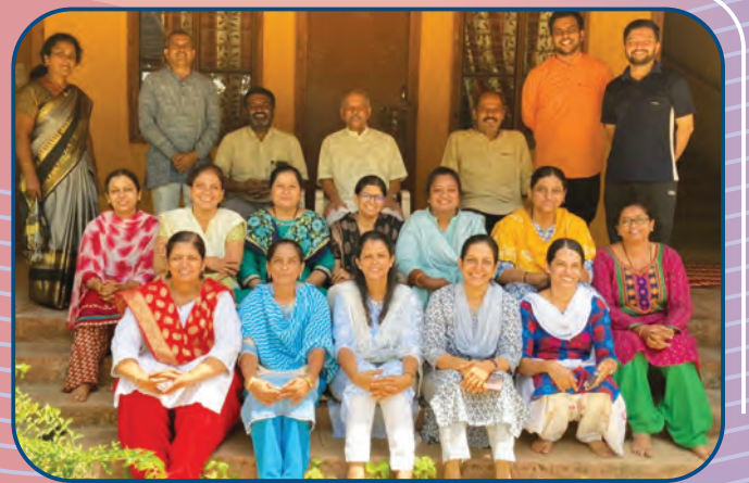
आचार्यव्रत शिबिरात सहभागी अध्यापक व मार्गदर्शक सदस्य