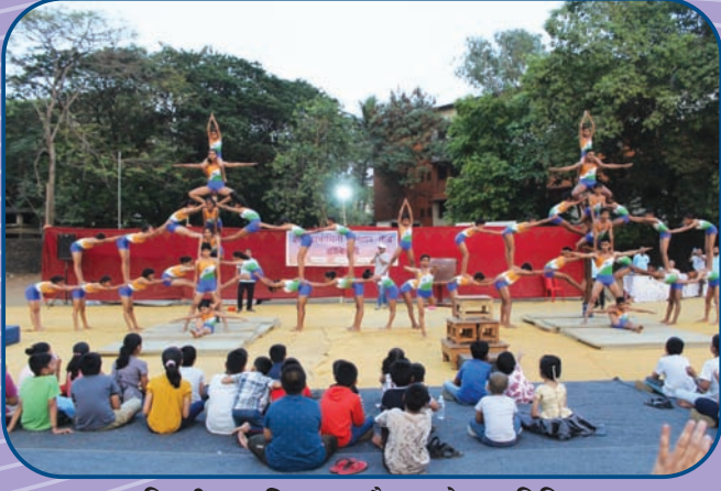
निगडीच्या क्रीडाकुल रौप्य महोत्सवानिमित्त डॉ.बिवली येथे प्रात्याक्षिके करताना खेळाडू