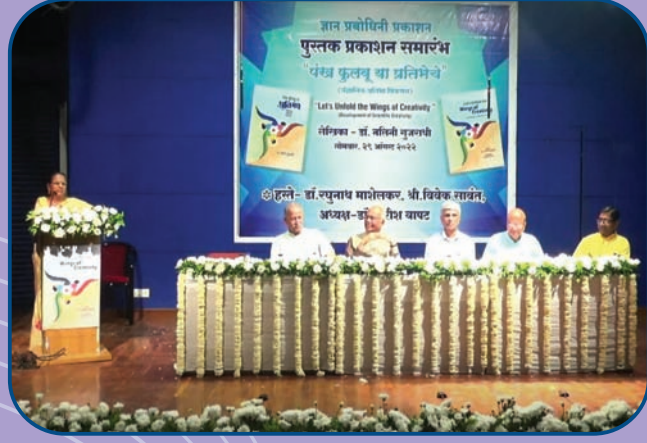
पंख फुलवूया प्रतिभेचे या पुस्तकाच्या प्रकाशन सोहळ्यातील क्षणचित्र