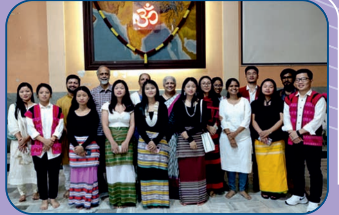
ज्ञानसेतू मेळाव्यात सहभागी सदस्य