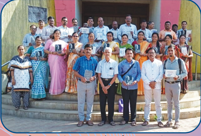
चिपळूण मधील अध्यापकांना दुर्दम्य आशावादी या डॉ. माशेलकर यांच्या चरित्राचे वाटप