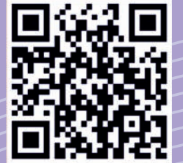
ज्ञान प्रबोधिनी ट्विटर पेज