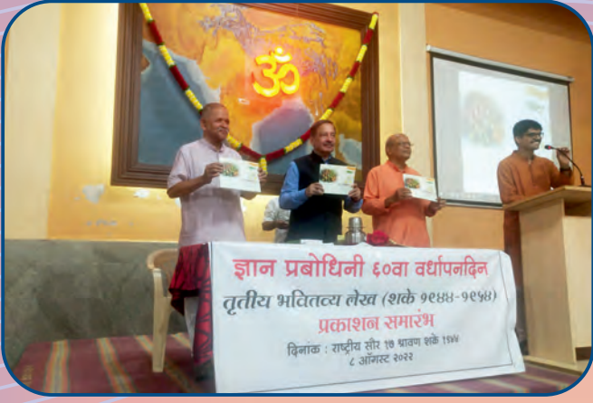
ज्ञान प्रबोधिनीच्या साठव्या वर्धापन दिनाला तिसऱ्या भवितव्य लेखाचे प्रकाशन