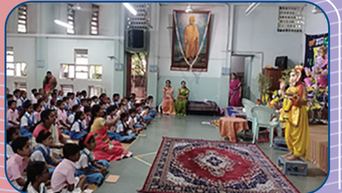
सोलापूरमधील "मी गणपती बोलतोय" कार्यक्रमातील क्षणचित्र