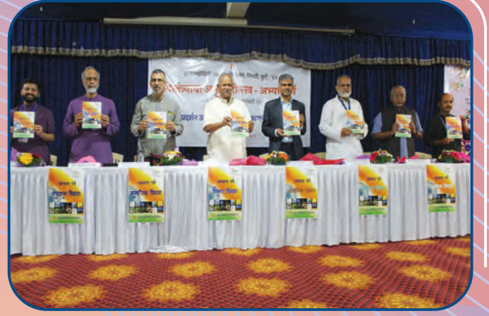
निगडी केंद्रातील अभ्यासपर्व पुस्तक प्रकाशन कार्यक्रम