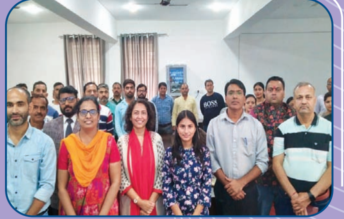
शैक्षणिक साधन केंद्राचा सांबा जम्मू येथील जिल्हास्तरीय प्रशिक्षण वर्ग