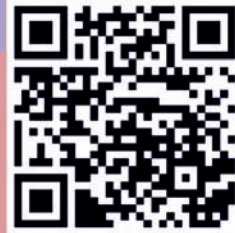
ज्ञान प्रबोधिनी इंस्टाग्राम पेज