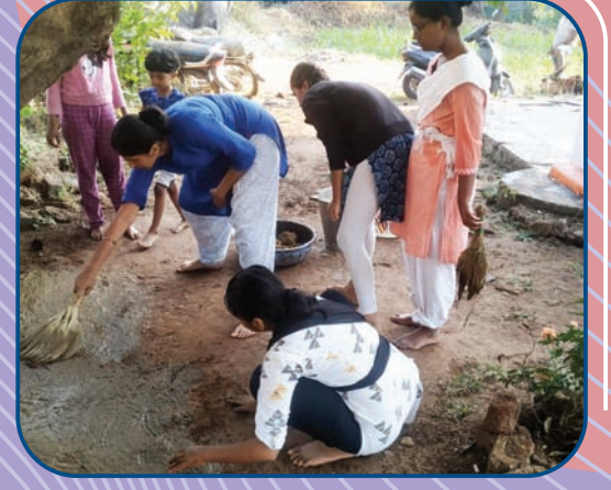
युवती विभागाच्या ग्रामीण परिचय शिबिरातील गटकार्य