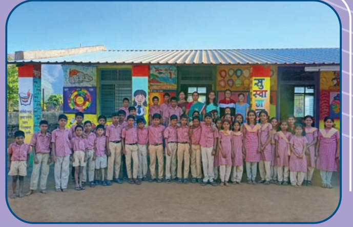
नेतृत्व संवर्धन केंद्रातील विद्यार्थ्यांच्या ग्रामीण परिचय शिबिरात वेल्ले भागातील शाळेला भेट