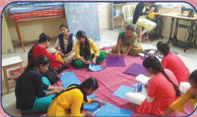
हराळी केंद्र युवतींसाठी जास्वंद वर्ग