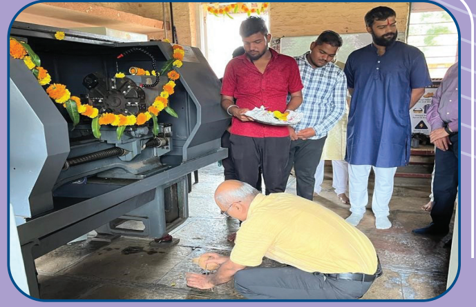
कौशल्य प्रशिक्षण केंद्रात खंडेनवमीनिमित्त यंत्रपूजन, शिवापूर