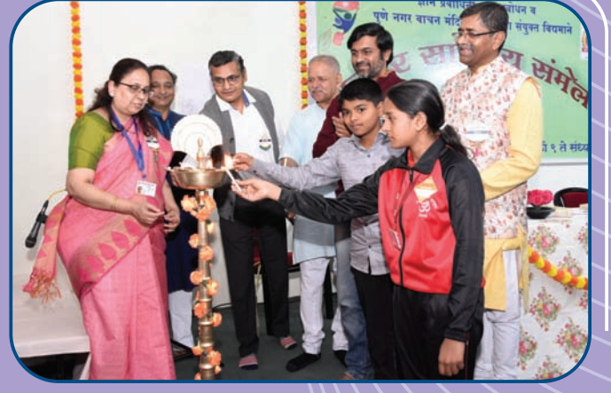
कुमार साहित्य संमेलन उद्घाटन प्रसंगी विद्यार्थी व मान्यवर