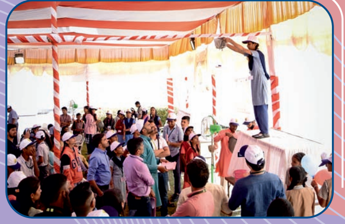
छोटे सायंटिस्टस् समस्या परिहार स्पर्धेतील एक क्षण