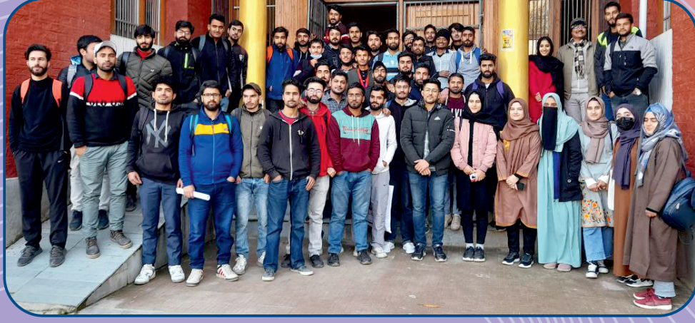
कुपवाडा, काश्मीर येथे स्पर्धा परीक्षा मार्गदर्शन वर्गात सहभागी विद्यार्थी