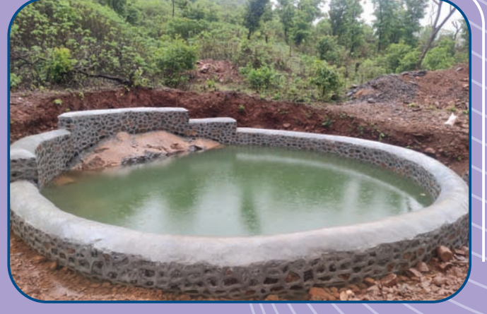
मुगाव, ता. मुळशी येथे प्रबोधिनीने खोदलेली विहीर