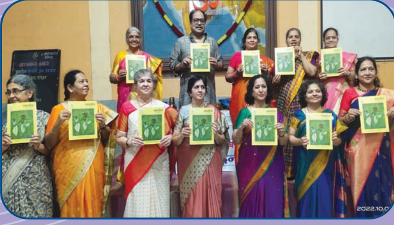
समतोल दिवाळी अंक प्रकाशन कार्यक्रम