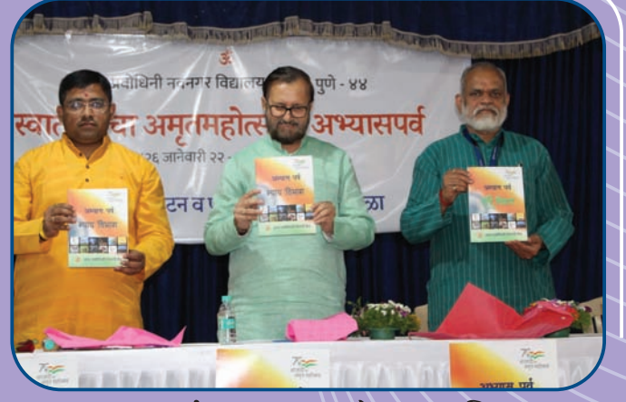
अभ्यासपर्व पुस्तक प्रकाशन सोहळ्यात उपस्थित माजी केंद्रीय मंत्री श्री. प्रकाश जावडेकर