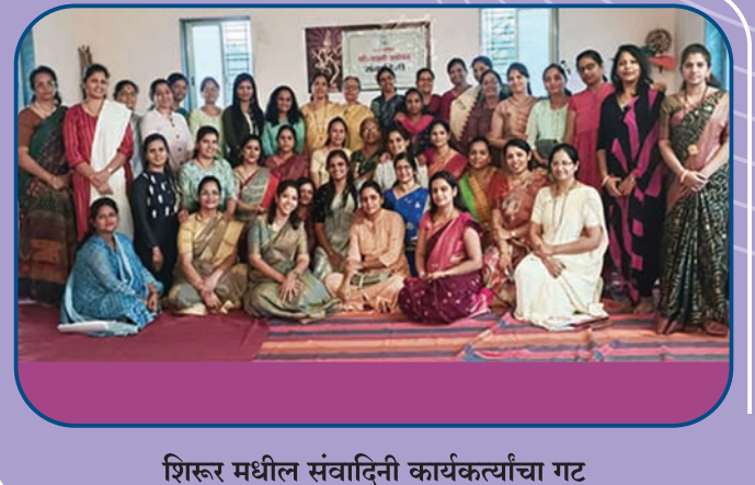
शिरूर मधील संवादिनी कार्यकर्त्यांचा गट