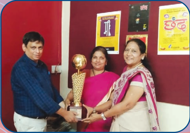
समतोल द्वैमासिकाला मिळालेला छंदश्री पुरस्कार स्वीकारताना संपादक मंडळ प्रतिनिधी