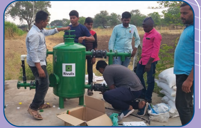
हराळी केंद्र कृषी विद्यालयातील ठिबक संच जोडणीचे प्रात्यक्षिक