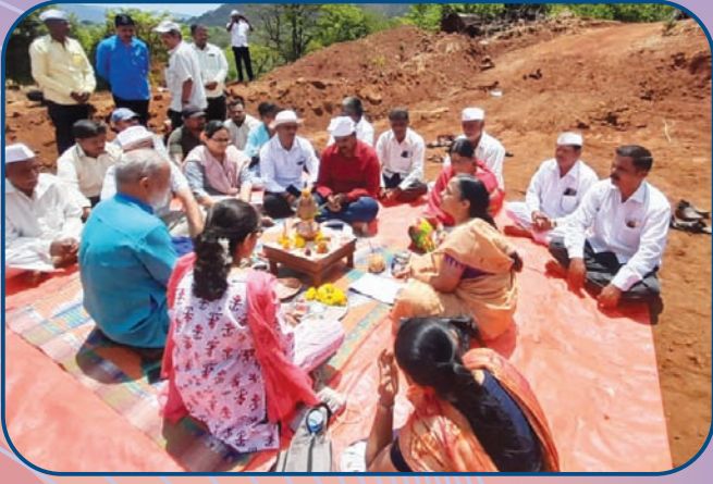
धडवली येथील विहीर लोकार्पण कार्यक्रमातील क्षणचित्र