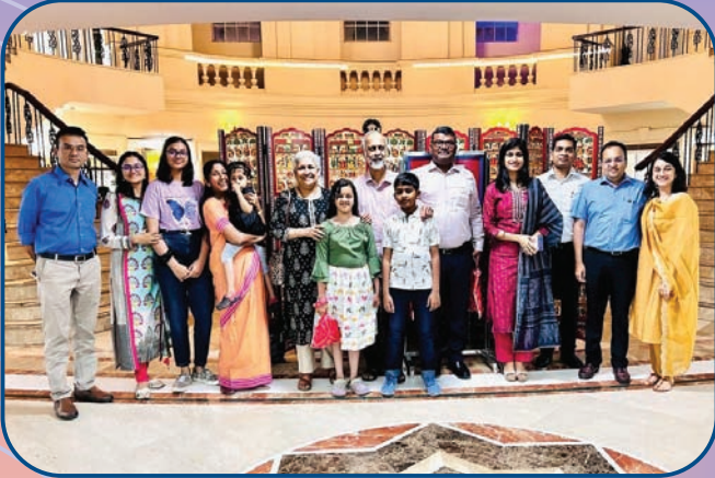
स्पर्धात्मक अभिवृत्ती संवर्धन केंद्र उत्तर भारत दौरा