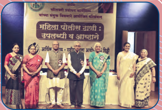
महिला पोलीस ठाणी परिसंवादात सहभागी मान्यवर सदस्य