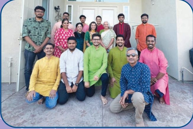
ज्ञान प्रबोधिनी फौंडेशनच्या कार्यकर्त्यांची कॅलिफोर्निया येथील बैठक