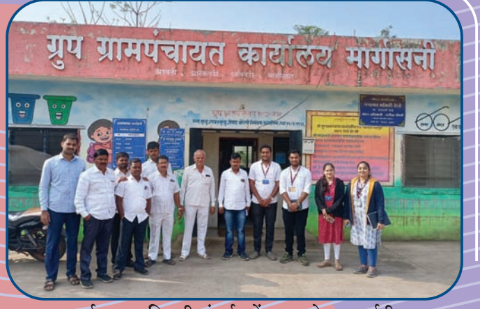
स्पर्धात्मक अभिवृत्ती संवर्धन केंद्राच्या प्रेरणा वर्गातील विद्यार्थ्यांच्या गावभेटींचे क्षणचित्र