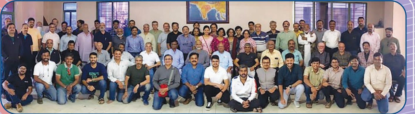
ज्ञान प्रबोधिनी प्रशाला अल्युम्नाय फौंडेशनतर्फे उद्योजक माजी विद्यार्थ्यांचा मेळावा