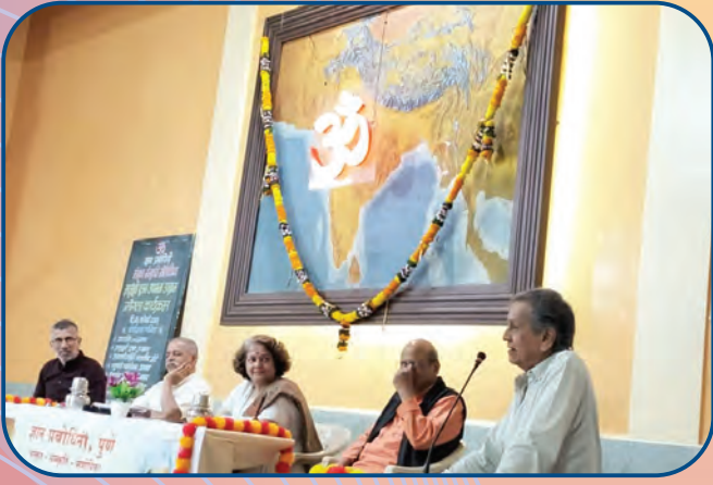
संत्रिका मातृभूमिपूजन सांगता कार्यक्रमात उपस्थित मान्यवर