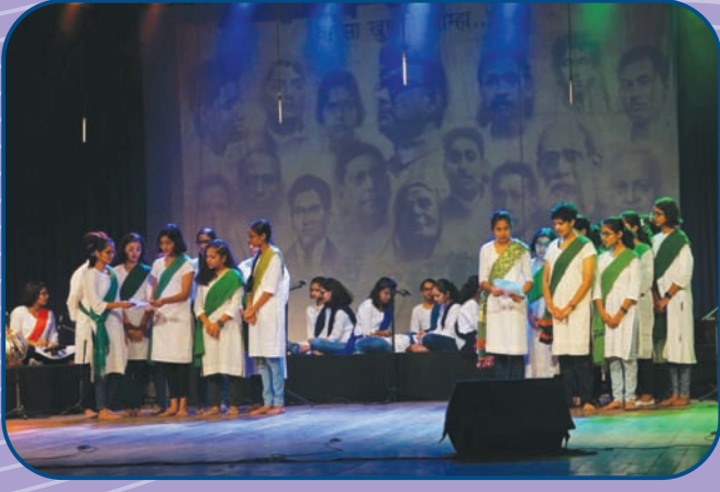
ज्ञान प्रबोधिनी प्रशालेतील विद्यार्थ्यांचे अभिव्यक्ती सादरीकरण