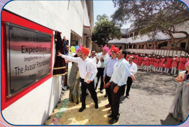
अवसर फाँडेशनचे प्रतिनिधी सालुंबे येथील नवीन कामाचे उद्घाटन करताना